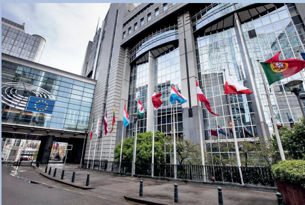
Kuva. Euroopan parlamentin Henrik Spaak -rakennus Brysselissä.

Vihreässä kirjassa esitetään ikääntymiseen liittyviä keskeisiä kysymyksiä ja pohditaan mahdollisia tapoja ennakoita ja reagoida Euroopan väestön ikääntymisen sosioekonomisiin vaikutuksiin. Vihreän kirjan prioriteetteja ovat aktiivinen ikääntyminen, työelämässä pysyminen, eläkkeelle jääminen, sen mahdollisuudet ja aktiivinen eläkeikä sekä ikääntyvän väestön kasvavat tarpeet.