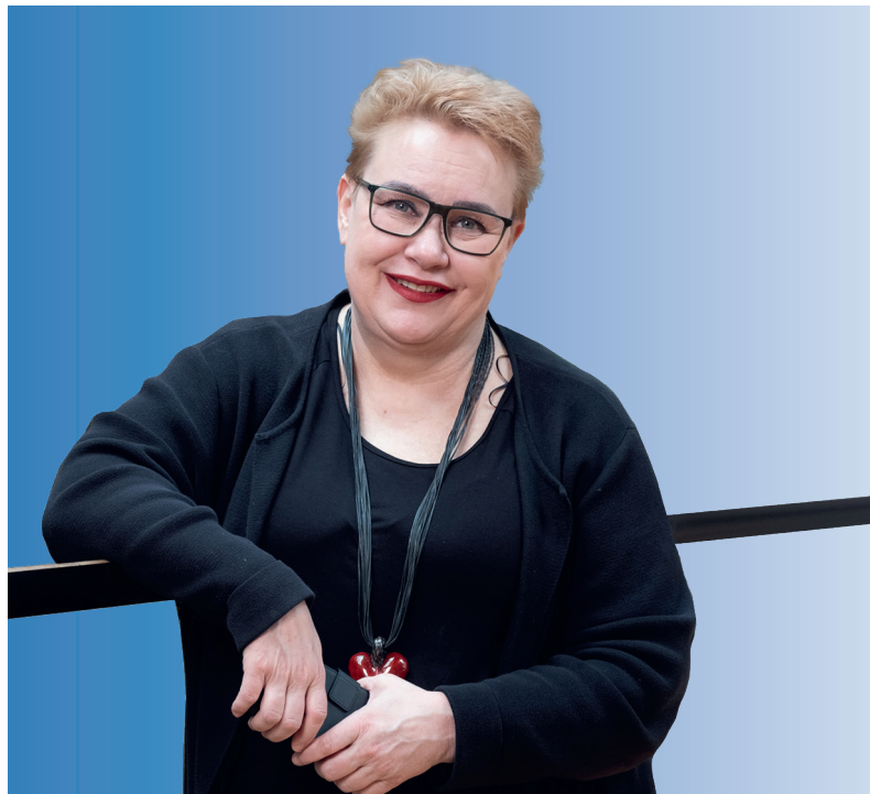
Kuva. Europarlamentaarikko Sirpa Pietikäinen.

Ikäystävällisyys liittyy myös moneen muuhun yhteiskunnan osa-alueeseen, ei ainoastaan sosiaali- ja terveyspalveluihin. Esimerkiksi elinympäristöjen tai verkkopalvelujen suunnittelussa pitäisi aina huomioida erilaiset ihmisryhmät.