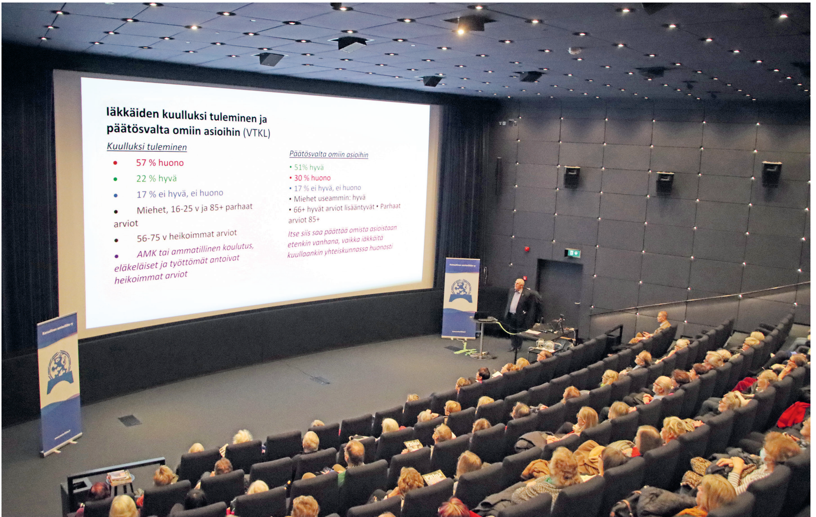
Kuva. Senioriliitto toteutti Helsingin keskustakirjasto Oodin tiloissa ikäihmisten ihmisoikeudet EU:ssa -tapahtuman 24.10.2023.

ratkaisut, liikkumisen esteettömyys, turvallisuuden eri muodoissa ja harrastusmahdollisuuksien turvaaminen, liittyvät yhdenvertaiseen kohteluun ja ovat näin ollen ihmisoikeuskysymyksiä. Haasteenamme on saada tämä huomio paremmin esille.