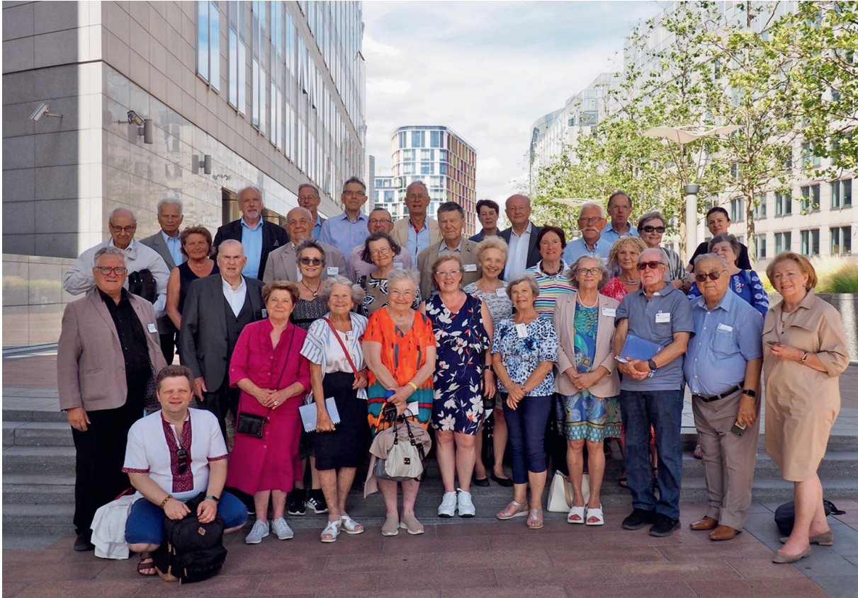
Kuva. ESUn vaikuttajia eri puolilta Eurooppaa.